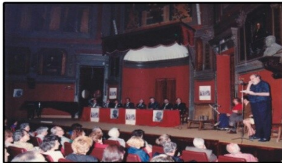
Tertulia de Rebotica sobre León Felipe celebrada el 4/06/1991.

Siempre habrá nieve altanera que vista al monte de armiño... y agua humilde que trabaje en la presa del molino. Y siempre habrá un sol también, un sol verdugo y amigo que trueque en llanto la nieve y en nube el agua del río.