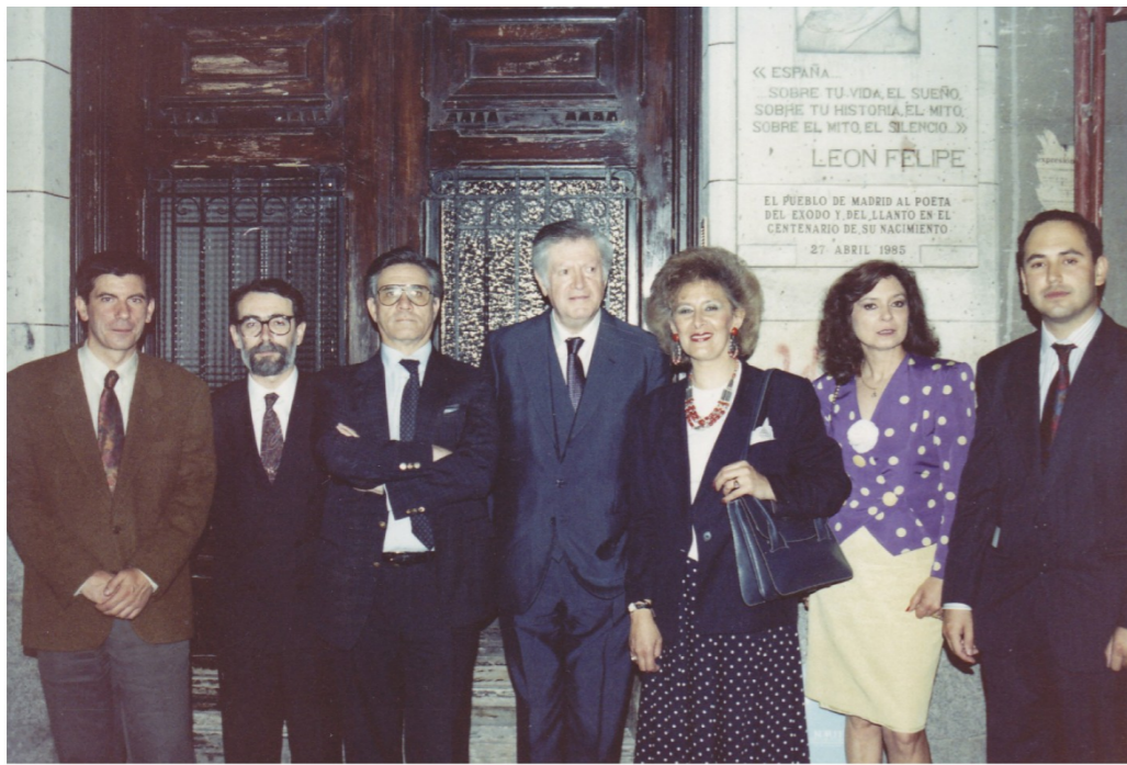
Participantes en la Tertulia sobre León Felipe, celebrada el 4 de junio de 1991